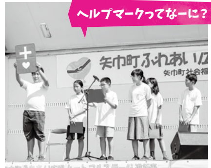
ジュニアボランティア探検隊