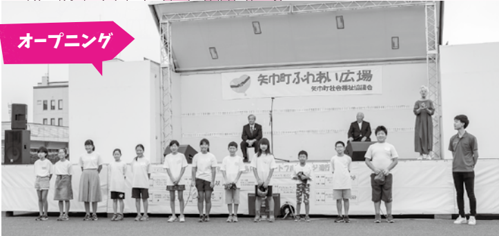
ジュニアボランティア探検隊による開会