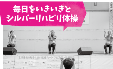
やはばりハさわかの会のみなさん