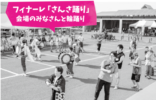
北郡山さんさ踊り保存会のみなさん