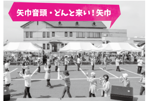
老人クラブ連合会女性部会のみなさん