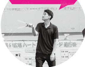
岩手医科大学パフォーマンス 同好会のみなさん