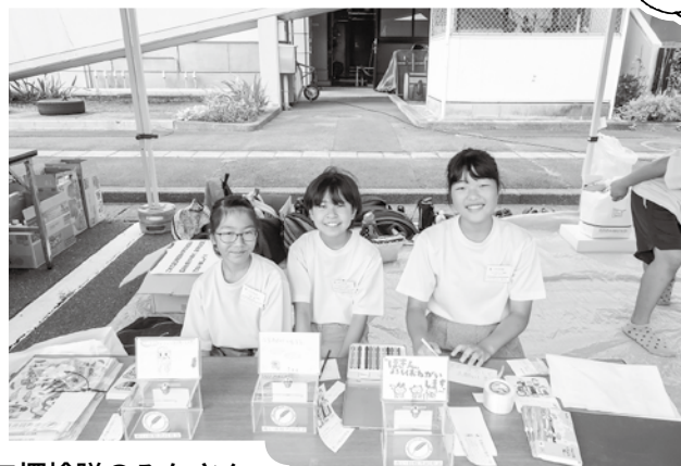
ジュニアボランティア探検隊のみなさん