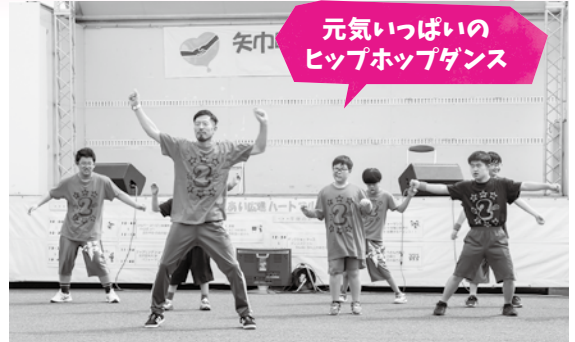
NPO 法人「未来の扉」FUN2FUN のみなさん