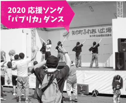
ダンススクール Studio BALL のみなさん