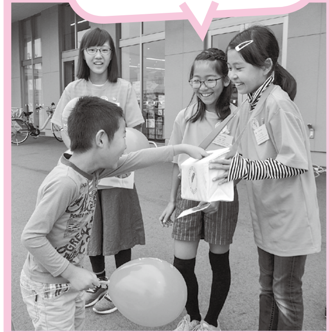
ビッグハウス矢巾店前