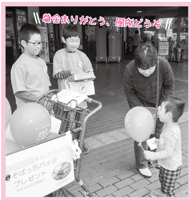
マックスバリュ矢巾店前