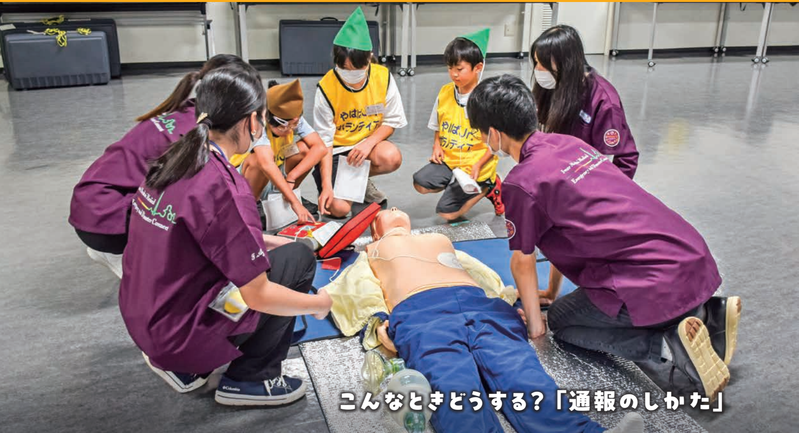
こんなときどうする？「通報のしかた」