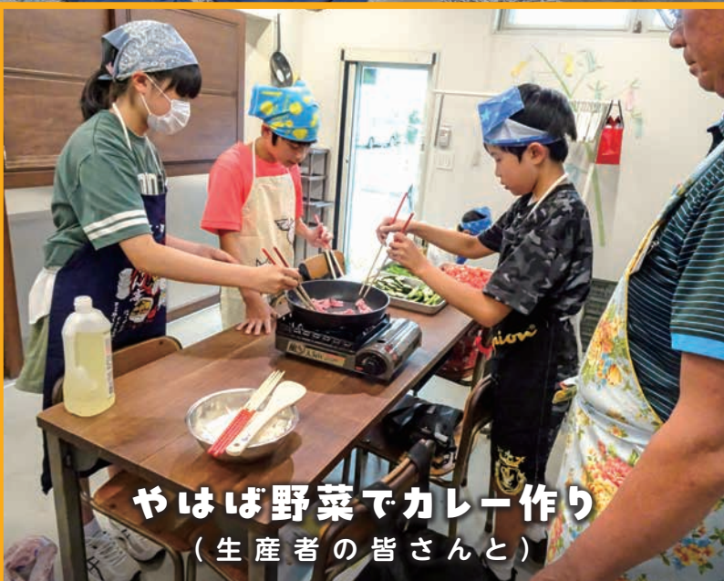
やはば野菜でカレー作り (生産者の皆さんと)