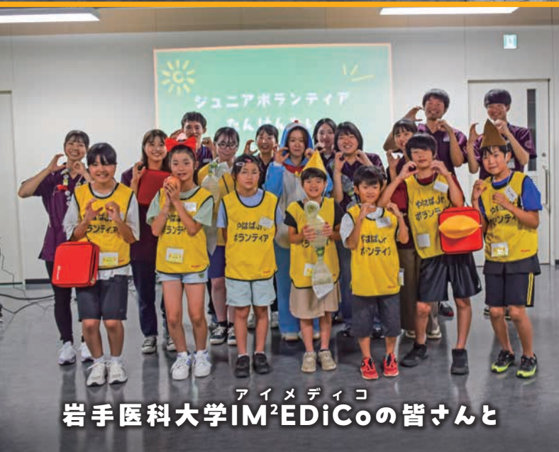
アイメディコ 岩手医科大学IM 2 EDiCoの皆さんと