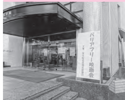
誰もが映画を楽しめる 「バリアフリー映画会」