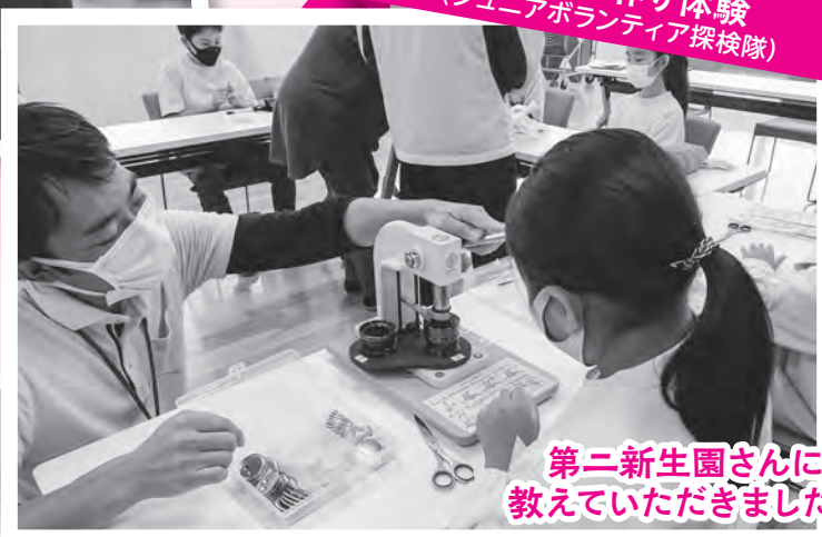
第二新生園さんに 教えていただきました!