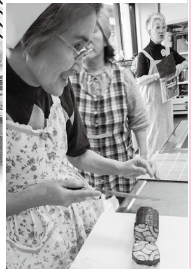
きれいな仕上がりに うれしい笑顔