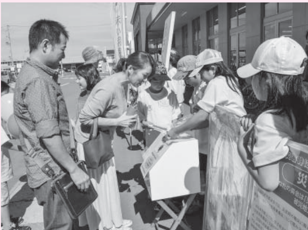
矢巾町ジュニアボランティア探検隊