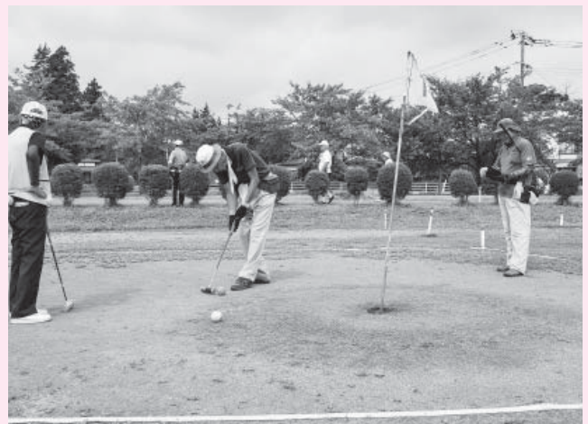
ゆうゆう広場（室岡）