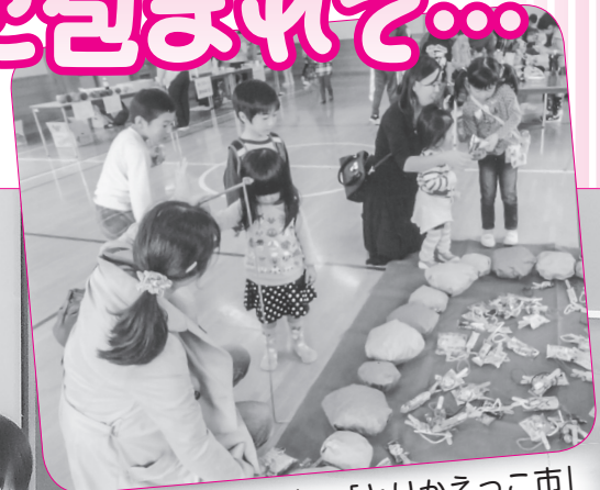
不動児童館恒例の「とりかえっこ市」 たくさん親子で大盛況！