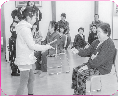
おでんせ広場の皆さんと煙山児童館の子どもたち 「最初はグー！じゃんけんポン！」