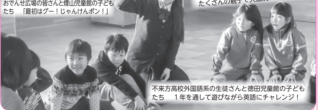
不来方高校外国語系の生徒さんと徳田児童館の子どもたち 1年を通して遊びながら英語にチャレンジ！

熊本地震で被災された皆さまに心よりお見舞い申し上げます。町民の皆さまからお預かりした温かい募金は、日本赤十字社を通じて被災地に送られます。ご協力たいへんありがとうございます。