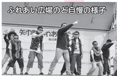
ふれあい広場のど自慢の様子

ふれあい広場、健康福祉まつり、金婚式、いきいき福祉交流会、福祉のまちづくりセミナーの開催 等