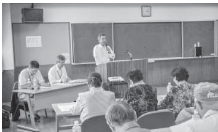
「日常生活たすけあい隊」研修会