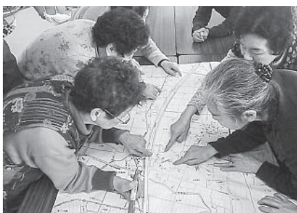
支え合いマップ作り

矢巾町社会福祉協議会では、平成二十七年度から、地域の高齢の方や障がいのある方等支援を必要とする方に対し、日常生活のちょっとした困りごとにお手伝いをする「日常生活たすけあい隊」の結成、また地域の問題の解決を見つけ出し解決に結びつけるための「支え合いマップ」の作成に取り組んでいます。 日常生活たすけあい隊は、老人クラブを中心に組織され、九クラブ（五十六人）、一般ボランティア三十人の登録があります（平成二十七年二月二十九日現在）。 支え合いマップ作成は、地域のサロンを中心に小区域から地域を見つめなおす場となっています。始動したばかりの「たすけあい隊」「支え合いマップ」ですが、今後次世代に伝えていく大きな地域の力となっていくことでしょう。 「日常生活たすけあい隊」や「支え合いマップ」について興味のある方、取り組んでみたい方は矢巾町社会福祉協議会（六一―二八四〇）までご連絡ください。