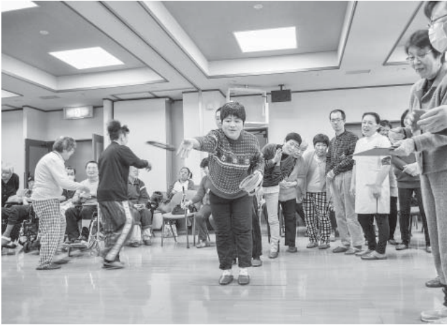
たくさんの声援に応じて・・・