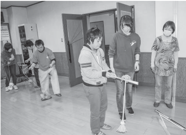
ジャグリングに挑戦！「むずかしいなあ・・・」

二月二十六日（金）さわやかハウスにて第二十六回いきいき福祉交流会が開催されました。「支え合い助け合う地域づくり」のために町内の福祉関係団体・施設・ボランティア団体に呼びかけ、参加者同士交流を深めることを目的としています。今年も、午前は輪投げ大会、午後は「ドキドキがっばい」と題して、岩手大学生を中心とし、県内外で人気沸騰中の「岩手ストリートパフォーマンスクラブ」の皆さんのショー。ハラハラ・ドキドキのジャグリングに拍手の嵐。参加者もバールンに挑戦したり、ジャグリングの道具に触れてみるなど、楽しい時間を過ごしました。からだも心もたっぷりほぐし、笑顔いっぱいの日でした。