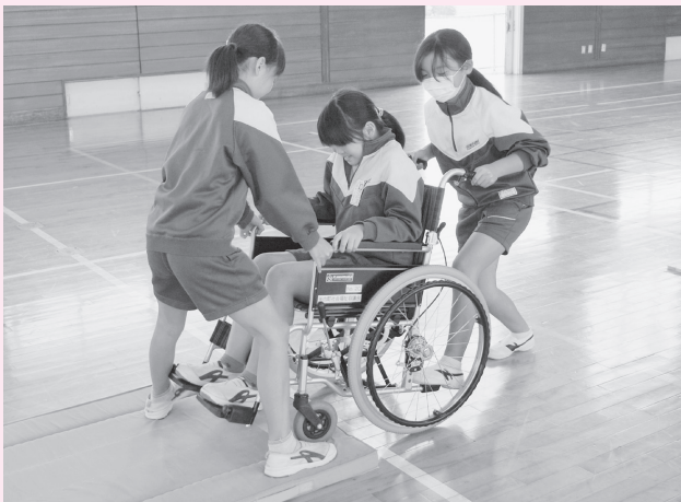
9月29日 煙山小学校キャップハンディ体験