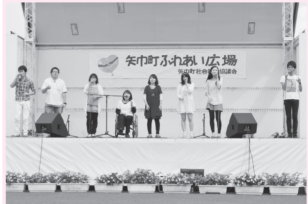
9月6日 矢巾町ふれあい広場 アカペラサークルVoccoの皆さん