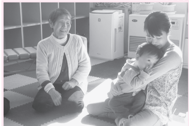
11月5日 おでんせ広場といちご広場 (徳田児童館幼児教室)交流会