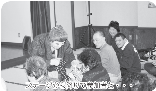
ステージから降りて参加者と・・・