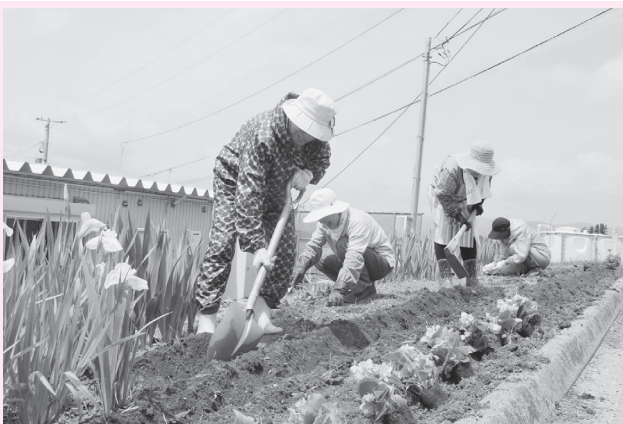
6月24日 陸前高田市西風道仮設住宅へ 花植えボランティア