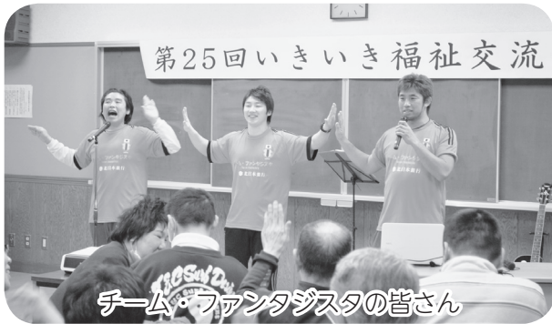
チーム・ファンタジスタの皆さん