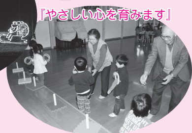
「やさしい心を育みます」