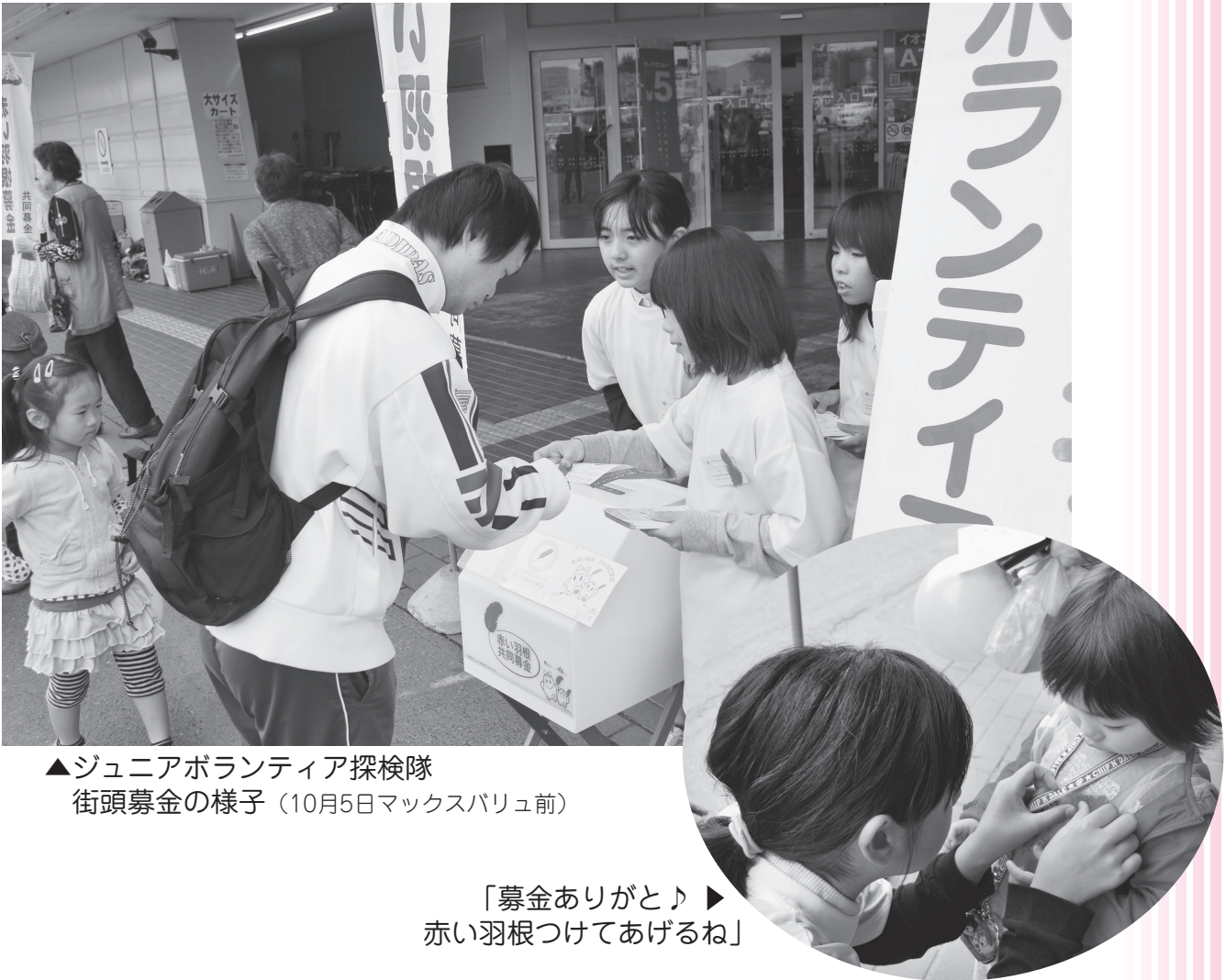
▲ジュニアボランティア探検隊 街頭募金の様子（10月5日マックスバリュ前）