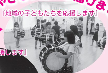
「地域の子どもたちを応援します」