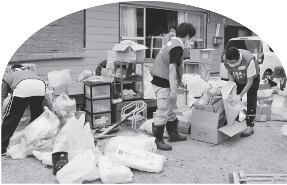
矢巾町災害ボランティアセンター活動の様子 (25.8.9大雨災害)

矢巾町災害ボランティアセンター活動の様子(25.8.9大雨災害) 矢巾町に贈りました。ご協力大変ありがとうございました。平成二十五年十二月二十六日現在。