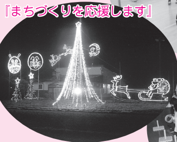
「まちづくりを応援します」