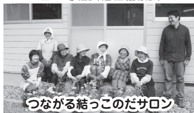
つながる結っこのだサロン 野田村社会福祉協議会

「赤い羽根共同募金」に寄せられた募金は、自分の町を良くする活動（地域福祉活動）に活用されています。ところが、大震災による被害が大きかった沿岸8市町村では募金運動の展開が難しいため、活動を支援する資金が不足している状態です。岩手県共同募金会では、沿岸8市町村で行われる地域福祉活動を応援するため、三月三十一日までの共同募金の期間延長を受け、「赤い羽根3.11いわて沿岸地域応援募金」を実施することとしました。募金の趣旨をご理解いただき、温かいご支援をお願いいたします。 矢巾町社会福祉協議会（さわやかハウス内）窓口に募金箱を設置しています。詳しくは下記ホームページをご覧ください。