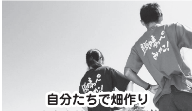
自分たちで畑作り 宮古市社会福祉協議会