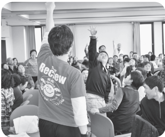
イエーイ！ 勝ったあ！！