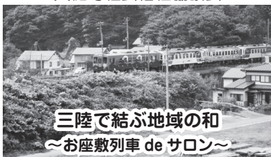
三陸で結ぶ地域の和 ～お座敷列車 de サロン～ 田野畑村社会福祉協議会