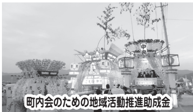
町内会のための地域活動推進助成金 陸前高田市社会福祉協議会