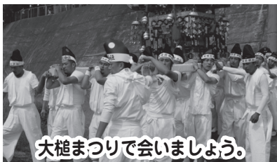
大槌まつりで会いましょう。 大槌町社会福祉協議会