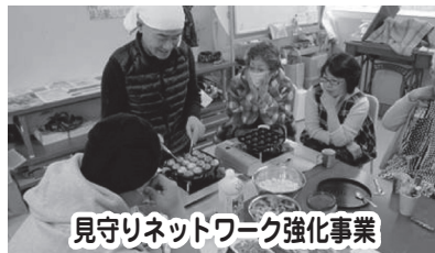
見守りネットワーク強化事業 釜石市社会福祉協議会