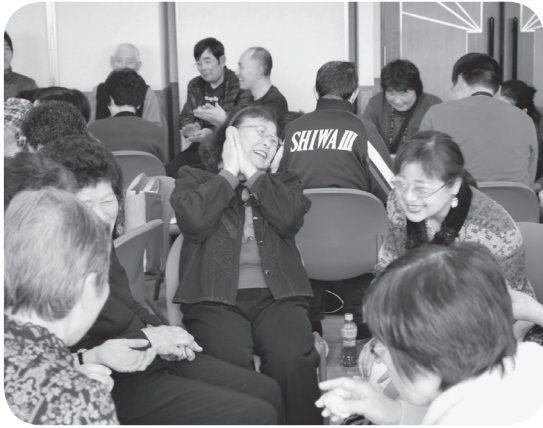
おとなりとも和気あいあい♡

また午後は、「矢巾町のやさしさ」を一本の木にするまちづくりワークショップを行いました。出来上がった「やさしさの木」を見て、「若い年代とのつながりを持つことがむずかしい」「困ったときに相談する場所はどこなんだろう」などの感想も聞かれ、自分の住む地域を見つめる場となったようです。今後の福祉のまちづくりに活かしていきたいと思えます。