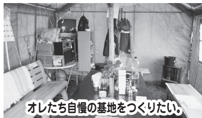
オレたち自慢の基地をつくりたい。 山田町社会福祉協議会