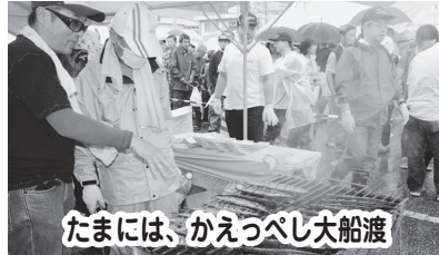
たまには、かえっぺし大船渡 大船渡市社会福祉協議会